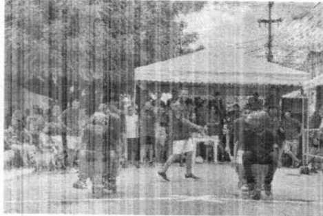
COMPETIDORES correm em duplas. Um guia o carro de mão e outro é transportado